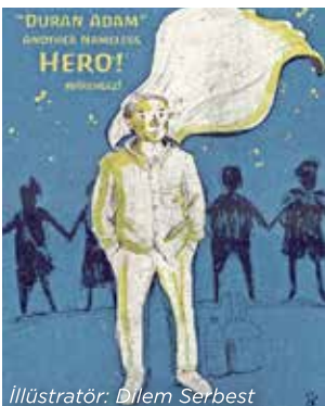
İllüstratör: Dilem Serbest

Gösterisinin ardından bir açıklama yapan Gündüz, polis şiddetine maruz kaldığı halde medya tarafından göz ardı edilenler için eylem yaptığını söyledi. Gündüz Hürriyet gazetesi ile yaptığı bir röportajda, “18-19 gündür Taksim’de direnen, Türkiye’nin birçok yerinde direnenler, anlaşılmalı. Bu nedenle, benim direnişim ve duruşum da anlaşılmalı olabilir. Ben nerede durdum? Haber ajanslarının ve herkesin odağı olan Taksim’de, görülsün diye durdum” dedi. 2