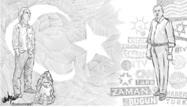
İllüstratör: Emrah Genç

Bu bakış açısı 116 sivil toplum örgütünden oluşan Taksim Dayanışması'nın, eylemlerin başından beri dillendirdiği direniş sebeplerinin de taleplerinin de temelini oluşturuyor.